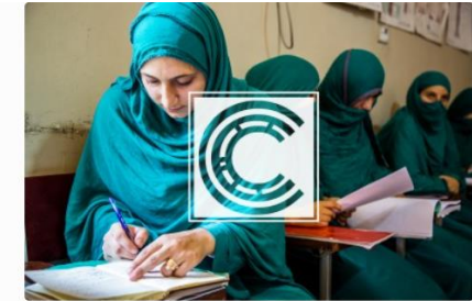
Career Development Plan Tool