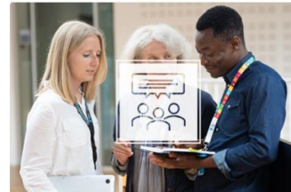
Career Conversations Toolkit