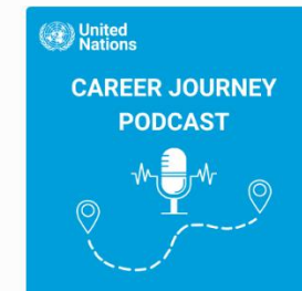
United Nations Career Journey Podcast