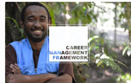
UNDP Career Management Framework