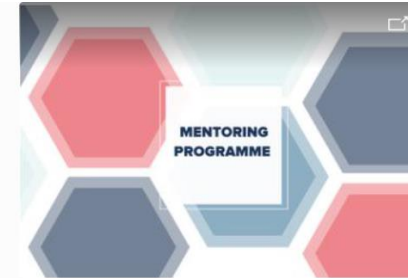
UNDP Global Mentoring Programme