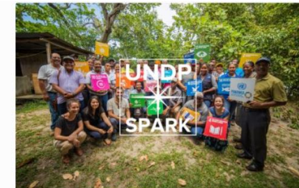
UNDP SPARK Programme