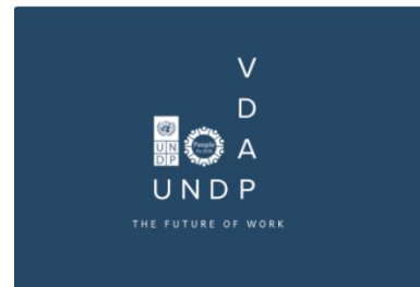
Virtual Development Assignment Programme