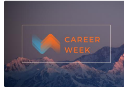
Career Week 2023